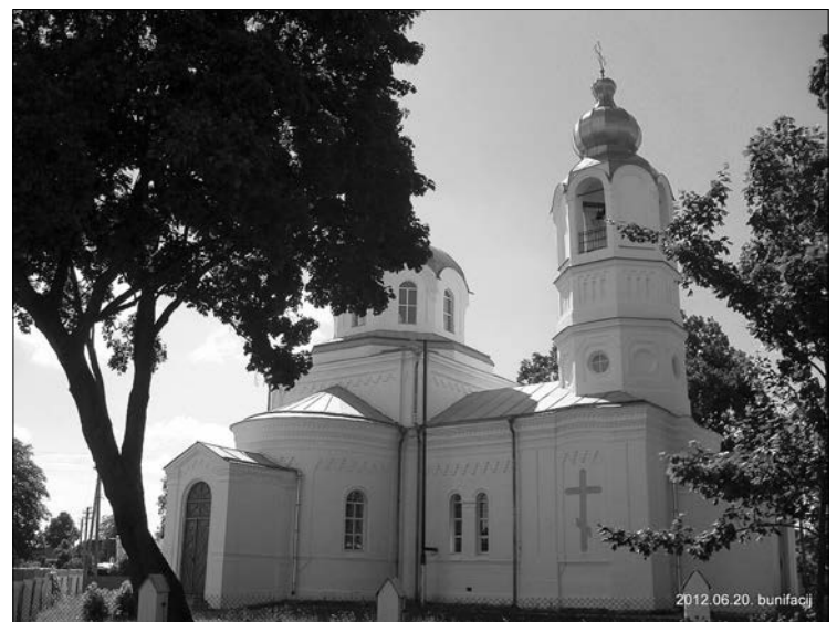
Na zdjęciu: Cerkiew Zmartwychwstania Pańskiego