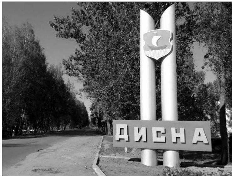
Na zdjęciu: Znak przy wyjeździe

Wjeżdżamy do Dżisny ulicą Łajdaka Michała Kalinina,