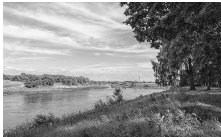
Na zdjęciu: Dźwina

Powolutku mijamy go samochodem, jadąc dalej skrajem zbocza nadrzecznego, aż do Kościoła Niepokalanego Poczęcia NMP, a właściwie tego, co po nim pozostało. Wzniesli go w 1773 r. w stylu barokowym, w miejscu kościoła drewnianego, wspomniani wcze-