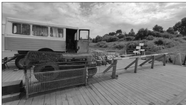
Na zdjęciu: Prom