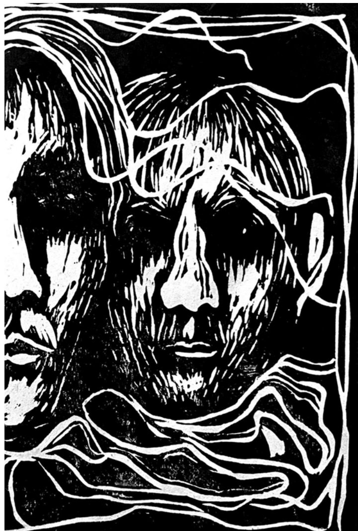
Milena Gazda-Szypulska Dwie twarze II linoryt