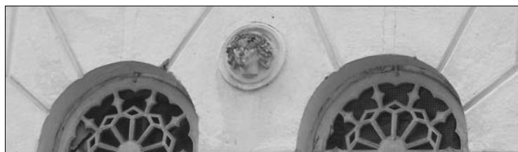
Na zdjęciu: Dekoracyjne detale

Podczas I wojny światowej pałac nie uległ zniszczeniu, natomiast władze nowopowstałego państwa litewskiego przejęły na własność Belweder i w 1921 roku urządziły w pałacu szkołę rolniczą, którą w 1927 roku przekształcono w technikum mleczarskie. Istniało ono również po II wojnie światowej i nawet wybudowano w pobliżu mleczarnię, w której uczniowie