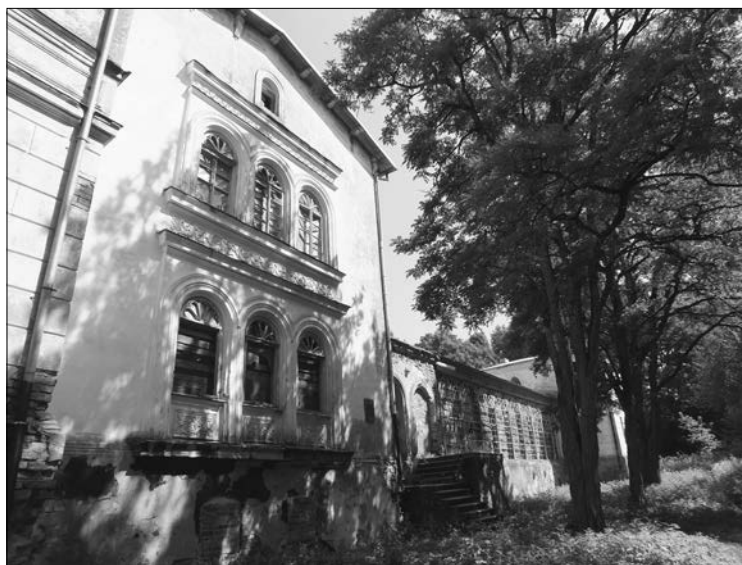
Na zdjęciu: Pałac od strony ogrodu

zdoływali umiejętności praktyczne. W 1961 roku średnia szkoła rolnicza została przekształcona w wyższą uczelnię o tym samym profilu. Wkrótce po odzyskaniu przez Litwę niepodległości belwederski pałac