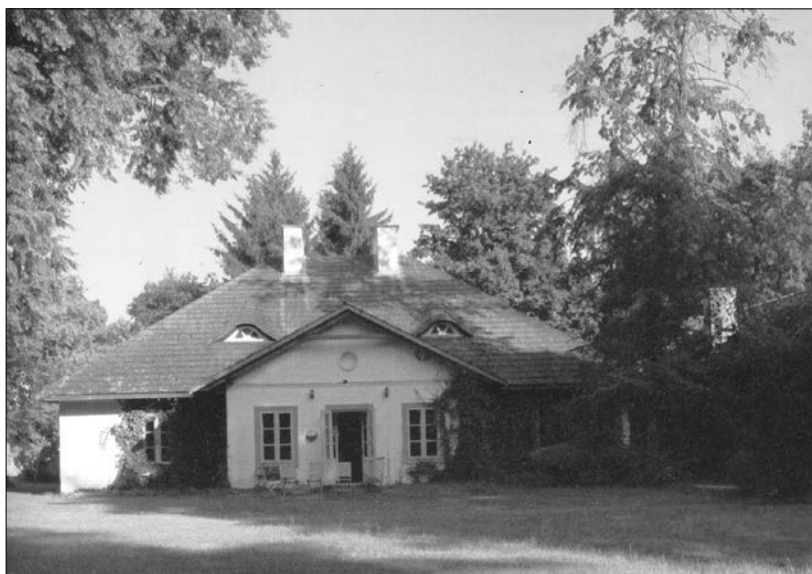
Na zdjęciu: Jagodne – dwór, odbudowany z ruiny przez prywatnych właścicieli

Dwór ten miał szczęście; przekazywany był po wojnie różnym poważnym instytucjom, takim jak Naczelną