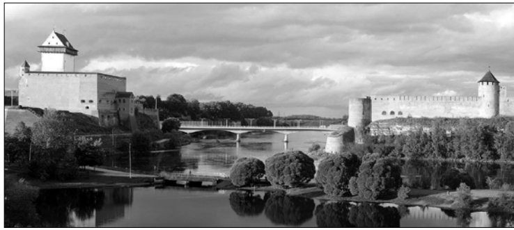
Na zdjęciu: Rzeka Narwa. Po lewej zamek w Narwie (Estonia), po prawej twierdza Iwangorod w Rosji. Pomiędzy nimi granica Unii Europejskiej i Rosji, a od wieków Wschodu i Zachodu