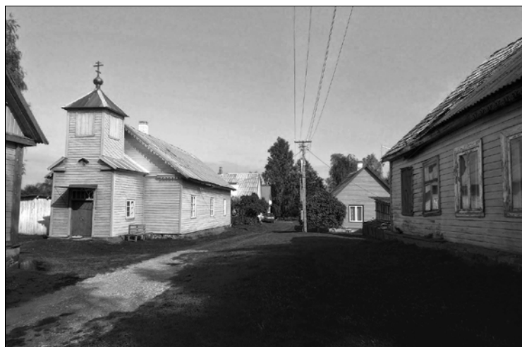
Na zdjęciu: Zabudowa na wyspie Piiri w Estonii. Widoczna jest molenka staroprawosławna. Tylko sieć napowietrzna energetyczna świadczy, że to nie XIX wiek