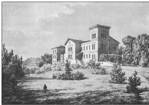
Na zdjęciu: Belweder na rysunku Napoleona Ordy w 1875 roku

w której urządzono zimowy ogród oraz pałacową kaplicę. W prawym rogu budowli wznie-