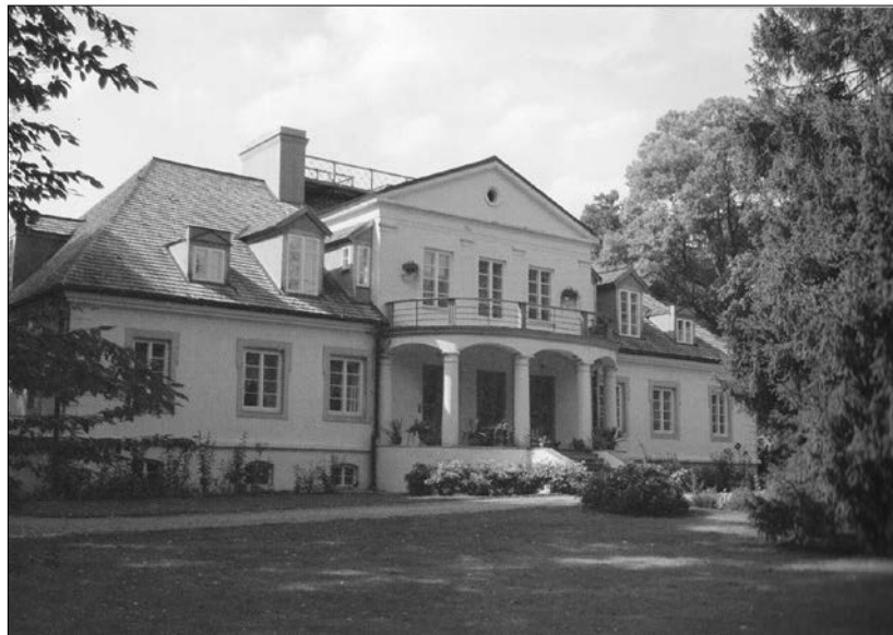
Na zdjęciu: Romanów – dwór, muzeum Józefa Ignacego Kraszewskiego

jest. Z jednej strony zrujnowane wojną państwo nie miało ani pieniędzy aby ratować tę historyczną substancję; były wtedy znacznie ważniejsze sprawy. Z drugiej strony powstał problem ideologiczny – dwory były relik-