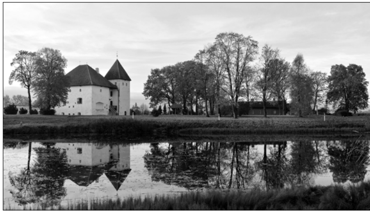
Na zdjęciu: Myza rycerska czyli dawny folwark rycerzy niemieckich w Purtsie w Estonii. Widoczny jest zamek...jednorodzinny!

obrazów za granicę. Podnieśli raban, zażądali...specjalnego zaświadczenia z ministerstwa! I bądź tu mądry! Kazali rozpakować wszystkie prace, dokładnie obejrzeni i...odmówili wyjazdu. Zaczęły się targi, konsultacje, narady czyli cała urzędnicza męka. W ruch ruszyły ważne telefony. Po godzinie, z łaską i kręcąc nosem, zgodzili się na przejazd. To nie koniec jeszcze – bystre oko celnika wypatrzyło w aucie wiecheć