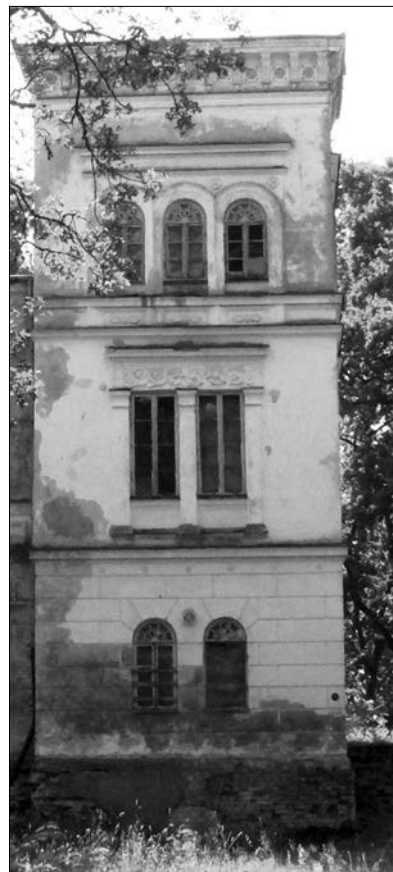
Na zdjęciu: Narożna wieża

Na nieregularnym planie stanęło na wysokich suterrenach kilka piętrowych korpusów połączonych parterową, przeszkloną galerią,