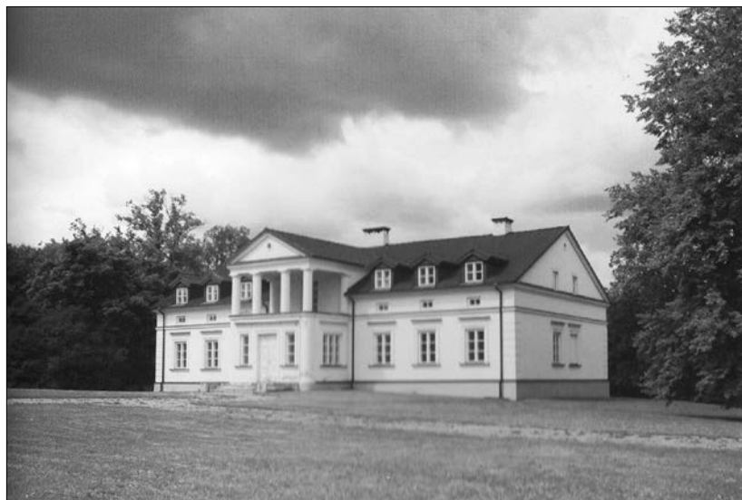
Na zdjęciu: Mołomłotki – dwór, do roku 1990 kompletna ruina

Dzieło jest trochę nużące, pozbawione autorskich komentarzy. Książka posiada charakter typowo encyklopedyczny. Brakuje swoistej barwy, która by przyciągnęła młodych czytelników do tego typu literatury. To nie jest poziom Tony Halika (1921