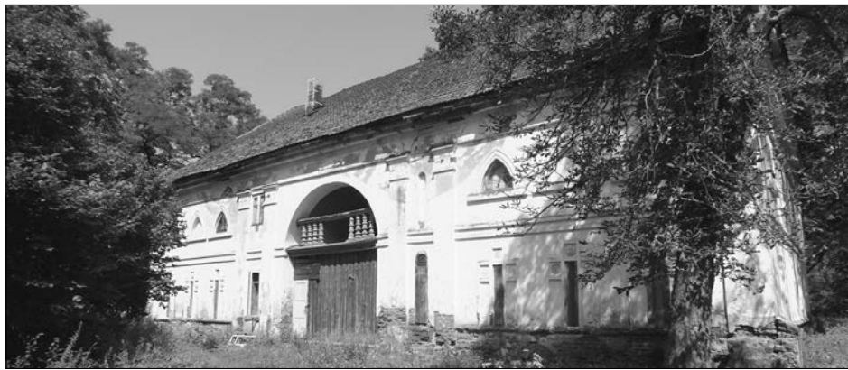
Na zdjęciu: Spichlerz

w której urządzono zimowy ogród oraz pałacową kaplicę. W prawym rogu budowli wznie-