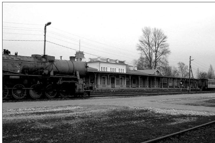
Na zdjęciu: Zabytkowy dworzec kolejowy w Hapsalu w Estonii. Widoczna tylko część najdłuższego w Europie drewnianego peronu.

Wrócili do Polski. Na dachu auta, przymocowali drewniany krzyż staroprawosławny, który zdychali ze zrujnowanego cmentarza starowierców. Na terenie Litwy, blisko naszej granicy, kierowca – Wielki Mistrz