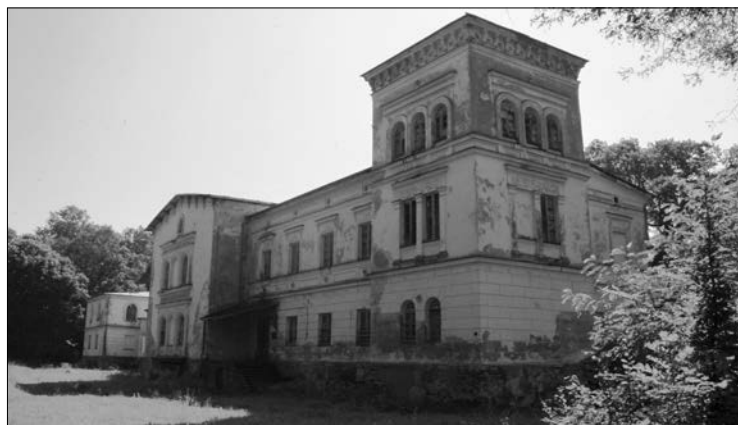
Na zdjęciu: Belweder w lipcu 2016 roku